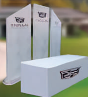
Mesas de Registro